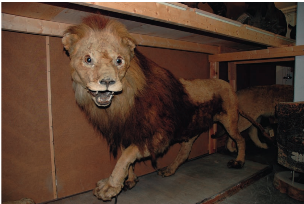
Lejon från Djurgården som var uppställt i Grills naturaliekabinett på Söderfors i nordöstra Uppland, numera i Naturhistoriska riksmuseets samlingar.

Kungl. Vetenskapsakademien, och det finns fortfarande kvar i Naturhistoriska riksmuseets samlingar. 23