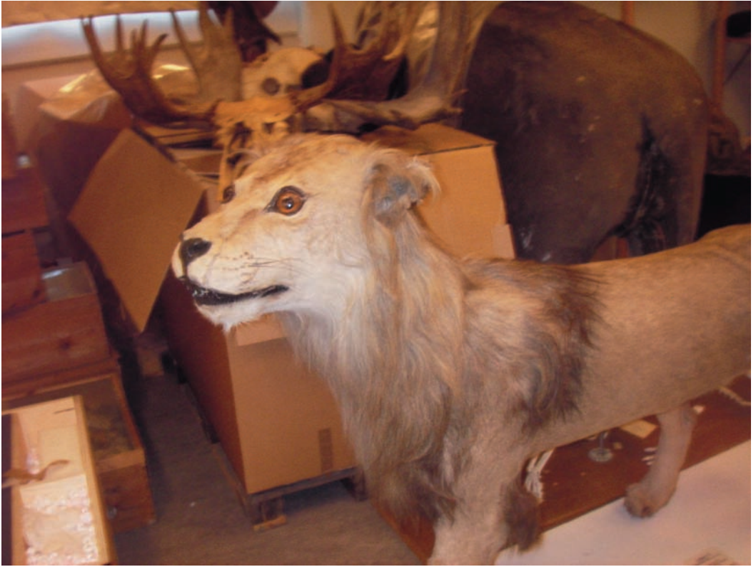
Thunbergs lejon, numera bevarad i uppstoppad form i Evolutionsbiologiska museets samlingar vid Uppsala universitet.

Thunberg noterar att det var också besynnerligt "att om hunden sedan flere gånger kastades på Loën, bjöd hvarken den förra till, att vidare angripa, eller den sednare, att försvara sig". I vilken utsträckning sådan djurhetsning fortfarande var vanlig