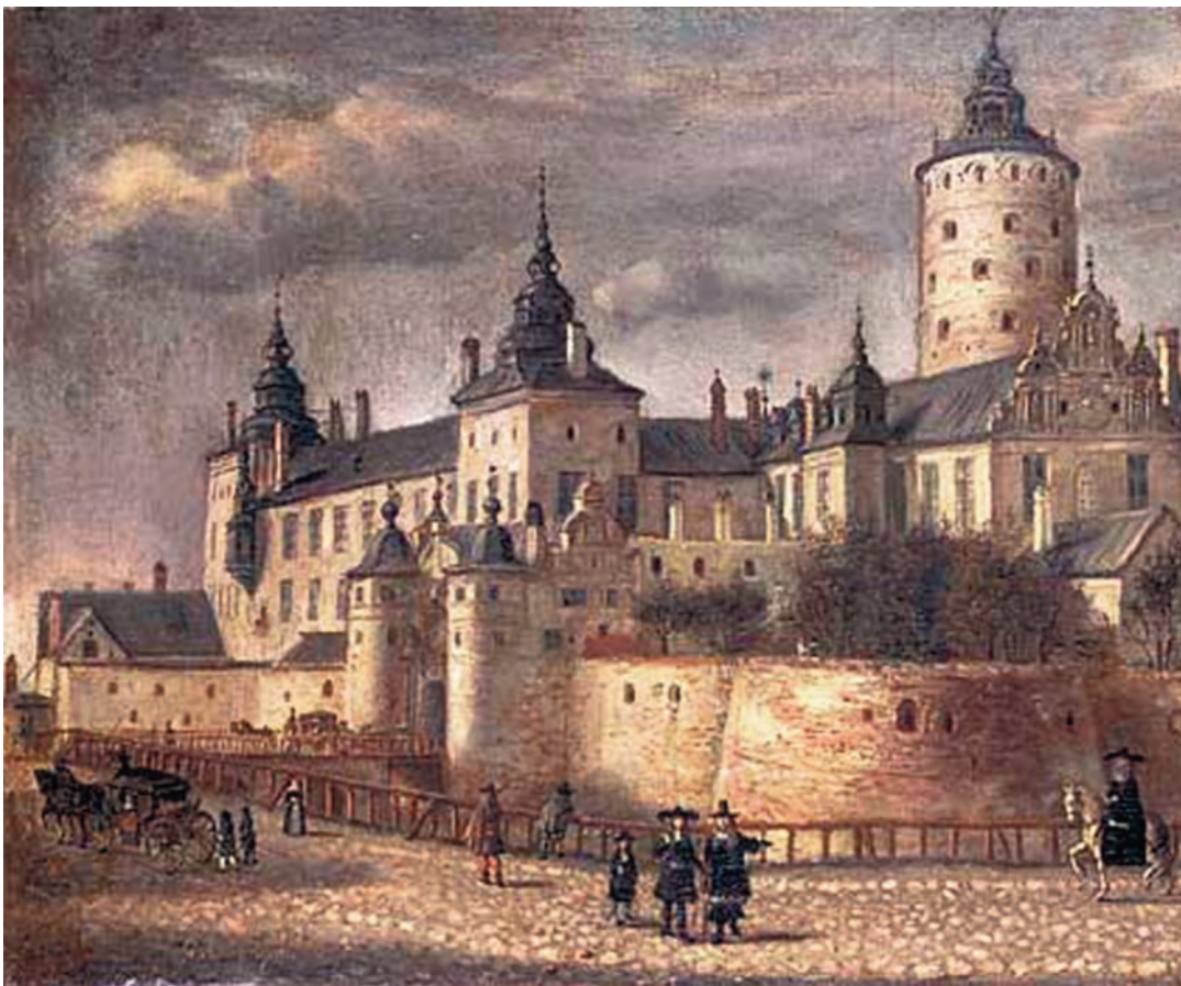
Fig. 1. Lejonkulan invid vallgraven till Stockholms slott. Oljemålning av Govert Camphuysen 1661 (Uppsala universitetsbibliotek).