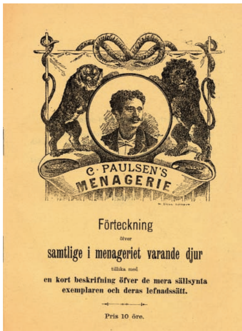
Katalogomslag med lejon och tiger till C. Paulsens menageri.

som i så fall skulle kunna vara ett exemplar av den likaså försvunna underarten kaplejonet, Panthera leo melanochaitus Ch. H. Smith, 1842. Men även ett nubiskt lejon fanns i samlingarna. Vidare hade man flera lejonungar, som var födda i menageriet: tre var födda 1894 och tre ungar var födda i danska Viborg den 25 juni 1895. Vidare hade man en tiger, flera svarta pantrar och leoparder, gepard, jaguar, serval, ozelot, isbjörn, brunbjörn från Norge, japansk björn, näsbjörn, tvättbjörn-